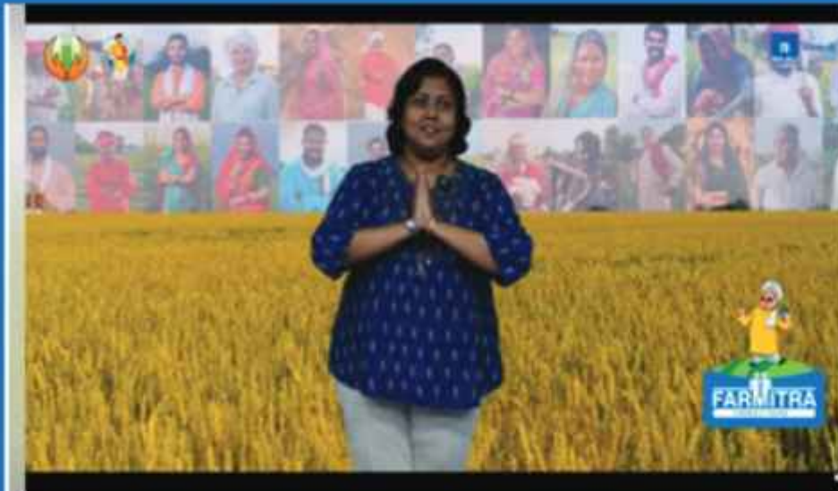
For the unwavering dedication and resilience of our farmers, PMFBY acts as a shield, prioritizing and protecting their interests in the face of challenges. This Kisan Diwas...