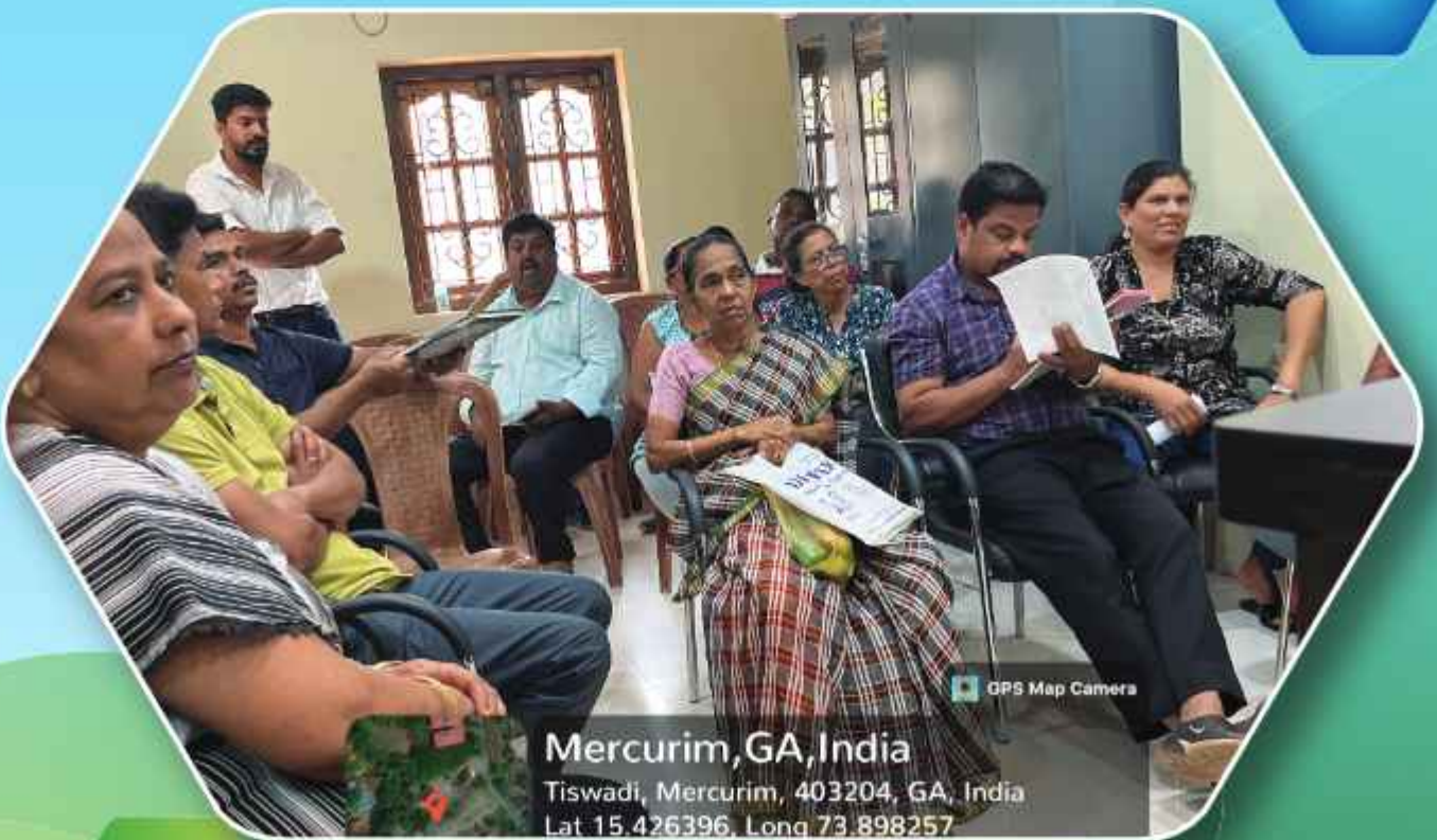
Mercurim, GA, India Tiswadi, Mercurim, 403204, GA, India Lat 15.426396, Long 73.898257