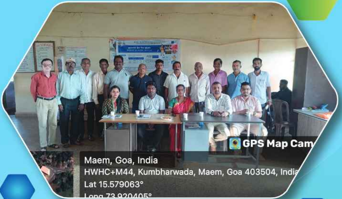
Maem, Goa, India HWHC+M44, Kumbharwada, Maem, Goa 403504, India Lat 15.579063° Long 73.920405°